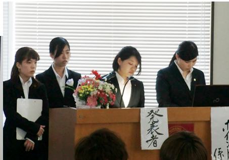
「コミュニケーションスキルと情報収集」 「生活習慣としての睡眠とスマホの関係」 「カップラーメンの嗜好」