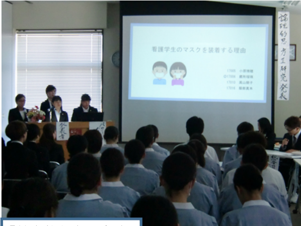
「効率的な学習方法」 「朝食摂取環境」