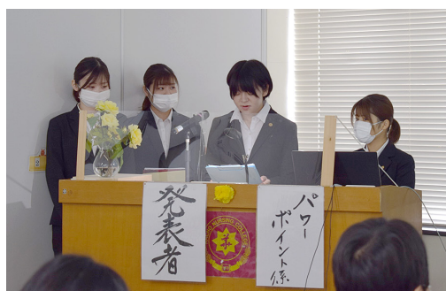
事例Ⅰ 大腿骨頸部骨折